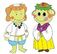
福崎町キャラクター「フクちゃん・サキちゃん」 古代バージョン